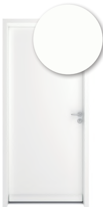
BLANC PUR RAL 9010