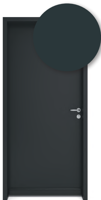
GRIS ANTHRACITE RAL 7016