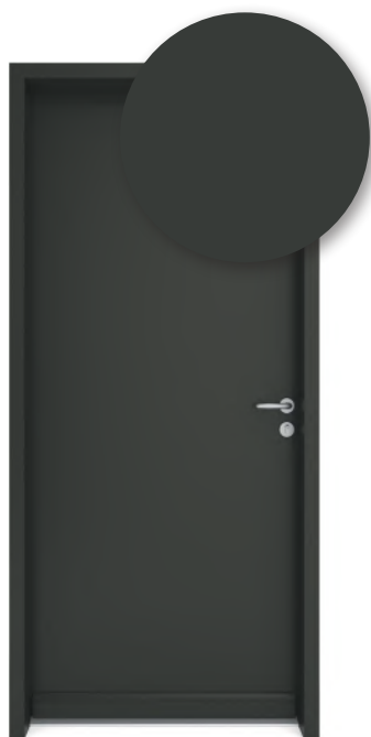
GRIS TERRE D'OMBRE RAL 7022