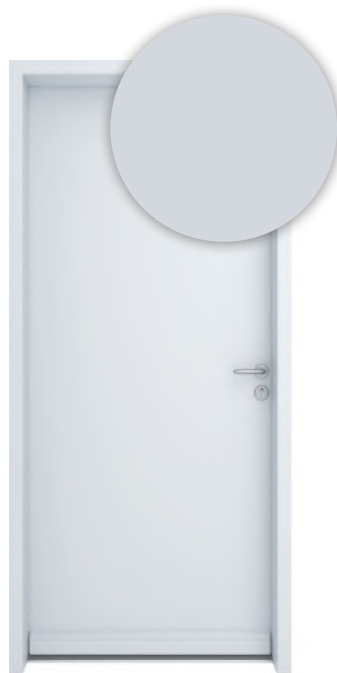
GRIS CLAIR RAL 7035