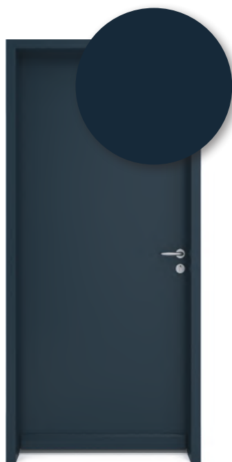
BLEU ARDOISE RAL 5008